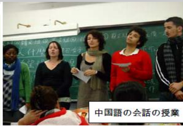
中国語の会話の授業