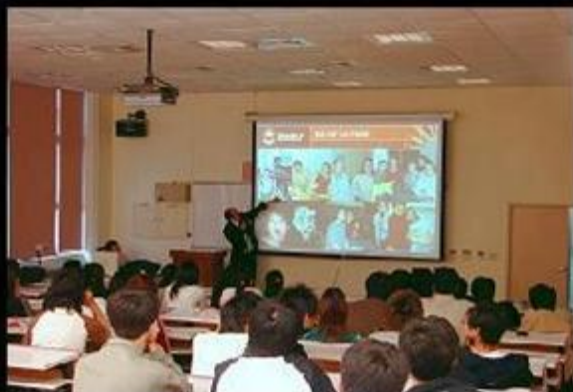
父母覺得淡大是這樣