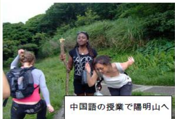
中国語の授業で陽明山へ