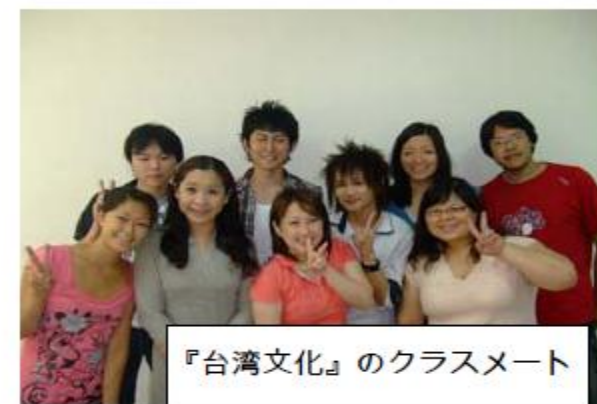
『台湾文化』のクラスメート