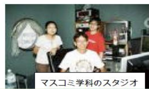
マスコミ学科のスタジオ