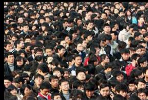
實際上淡大是這樣