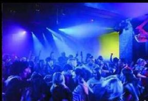
我本來覺得淡大是這樣