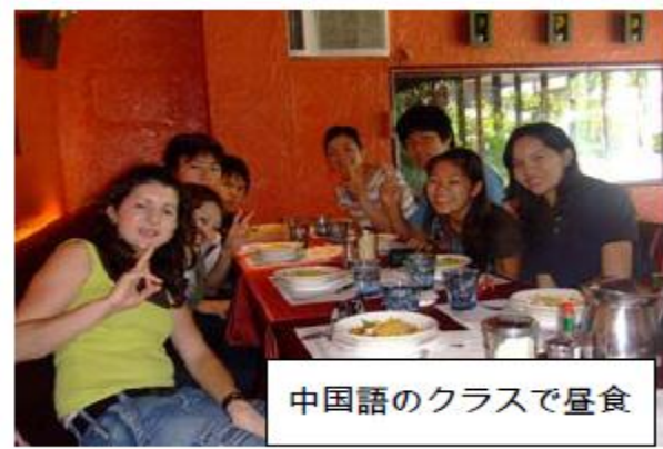
中国語のクラスで昼食