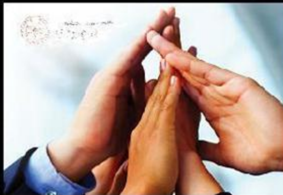
社會覺得淡大是這樣