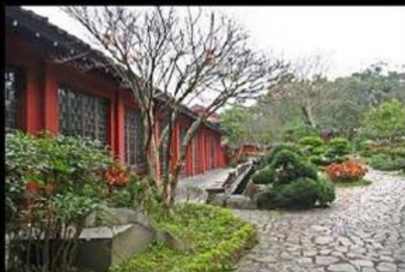
朋友覺得淡大是這樣