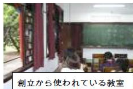
創立から使われている教室