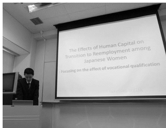
大学院生プロジェクト型研究成果報告会