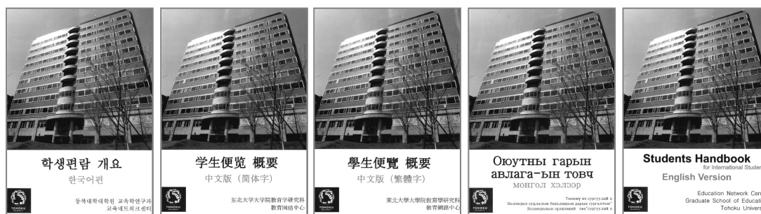
多言語版学生便覧 (2014年3月発行)

研究・教育の国際化が求められている現在、留学生の研究・教育環境をさらに整備することが求められている。センターでは、多言語（韓国語、中国語・簡体字、中国語・繁体字、モンゴル語、英語）による学生便覧、リーフレットの作成、および研究科 Web サイト (7) の運用を継続事業として行ない、留学生が抱える課題を把握するとともに留学生支援の実質化の方策について検討している。