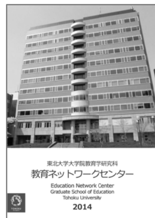
2014年度版パンフレット

教育ネットワークセンター(以下「センター」)は、現代社会のニーズに応えるプロジェクト研究や教育問題に関する支援事業、国際交流の推進、研究・教育の支援を主な目的として、教育ネットワーク研究室(2000年度設置)を改組、拡充する形で2006年12月20日に設立された。センターでは、研究プロジェクト部門、地域教育支援部門、国際交流部門、研究・教育支援部門の4つの部門を設け、広く社会とのネットワークの形成を図りながら、教育に関する諸問題の解決に向けた研究・支援事業を実施している(1)。以下、部門別に今年度の事業の概略を記す。