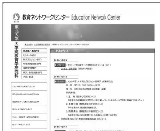
教育ネットワークセンターWeb サイト http://www.sed.tohoku.ac.jp/lab/edunet/