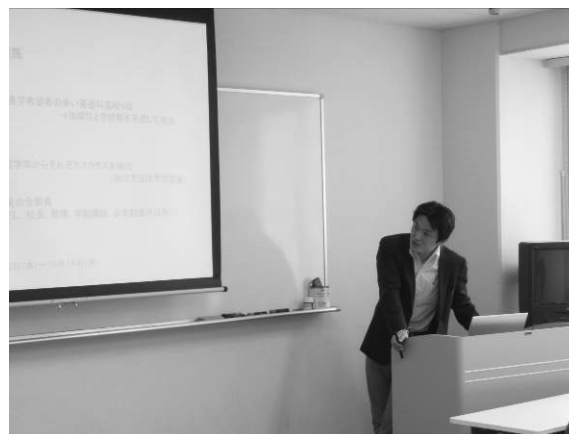
大学院生プロジェクト型研究成果報告会