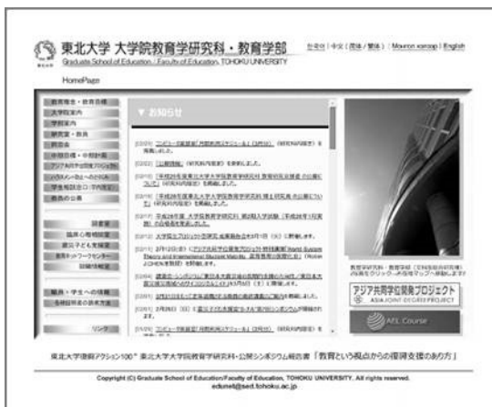
教育学研究科 Web サイト http://www.sed.tohoku.ac.jp

コンピュータ制御室では、研究科LAN運用のための基幹サーバおよび研究・教育に関するサービス提供のためのサーバの運用、その他研究・教育活動や広報活動にも活用される研究科Webサイトの管理運用を行なっている。